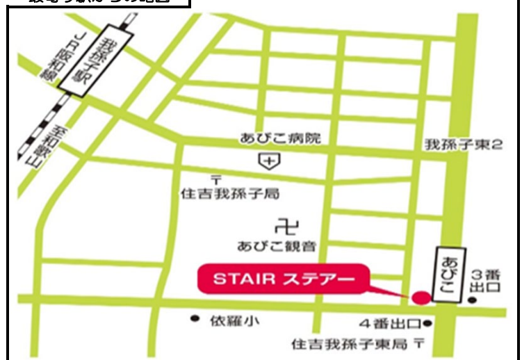
最寄り駅からの略図

地下鉄あびこ駅から徒歩1分。オーエストラックが入っているロイヤルキタノビルの3階です。